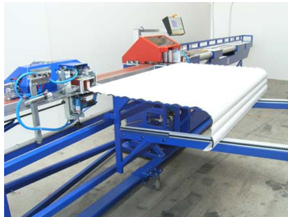
Table d'alimentation automatique pour lames individuelles et/ou nappes

La machine peut être adaptée aux besoins spécifiques de chaque client.